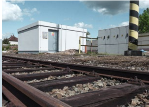
Záboří nad Labem