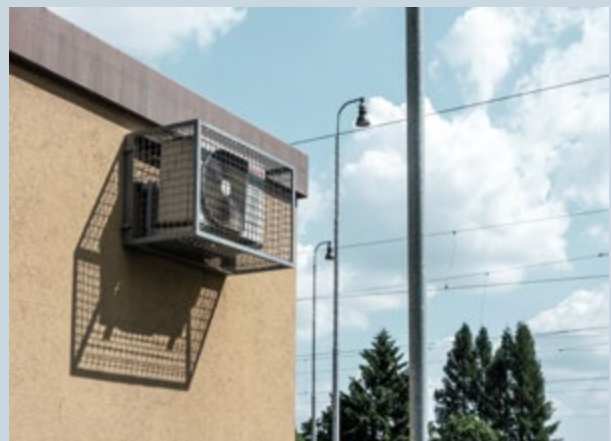
Ostrov nad Oslavou