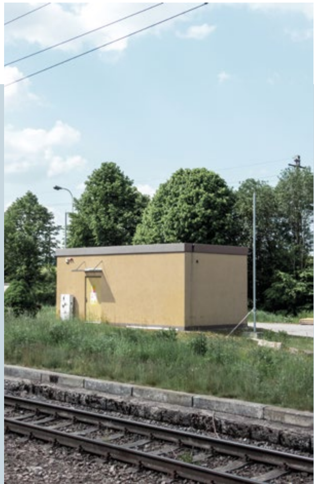
Ostrov nad Oslavou