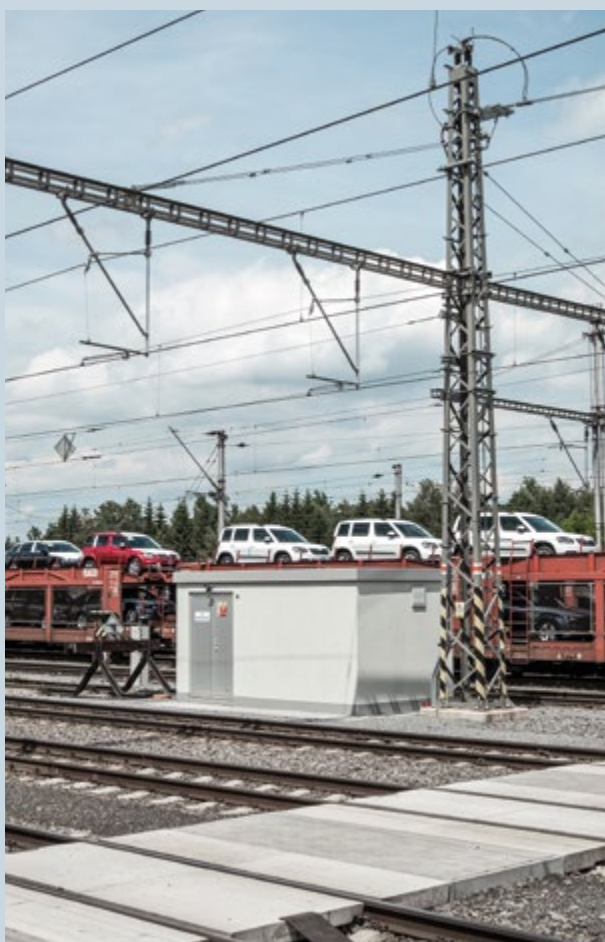
Týniště nad Orlicí