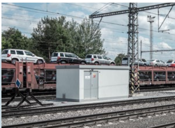
Týniště nad Orlicí