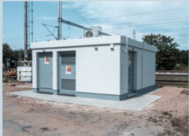
Záboří nad Labem